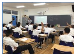
さかなプロダクション

生徒は最も興味のある2つの会社を事前を選び、各会場で講義を受けました。「身の回りにいる社会人=保護者・教員」である多くの生徒たちは、全く異なる環境で生きている講師の先生方からの話に大いに刺激を受けながら、現在取り組んでいる学習が将来にどのように結びつくのかを学ぶことができました。