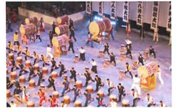
全国12チームによる自衛隊太鼓