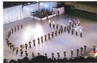
海上自衛隊東京音楽隊

11月15日(水)、日本武道館にて、平成29年度自衛隊音楽まつりのリハーサルが開催されました。本校からは吹奏楽部25名(高校12名、中学13名)が招待され、テーマONE「音が結ぶ、ひとつの想い」を鑑賞して来ました。どの演奏・マーチングも完成度が高く、全国12チーム約200名による自衛隊太鼓は正に圧巻！また、防衛大学校ファンシードリルは本校のブラバンのドリルに動きが似ているのは気のせいかな？!