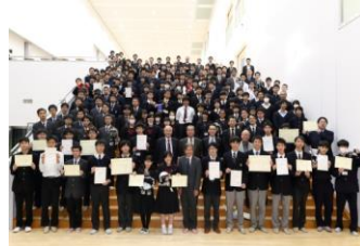
左中央:だるまさんが転んだ 右:玄関ホールにて記念写真